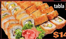
tabla ROYALE TEMPURA