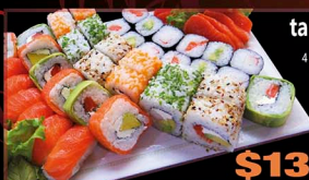
tabla PARA 2

47 PIEZAS 4 bocados de ciboulette 4 bocados de masago 4 bocados de sésamo 4 bocados de salmón 4 bocados de palta 9 cortes de sashimi 12 hosomaki 6 nigiri