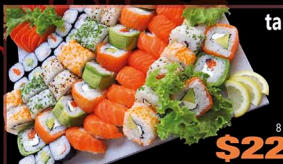
tabla PARA 4

91 PIEZAS 12 nigiri 24 hosomaki 15 cortes de sashimi 8 bocados de palta 8 bocados de salmón 8 bocados de sésamo 8 bocados de masago 8 bocados de ciboulette