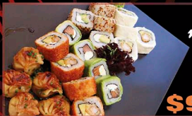
tabla MIX Haiku

21 PIEZAS 5 gyozas 4 bocados furai 4 bocados de palta 4 bocados de queso 4 bocados de sésamo