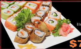
tabla MIX UNA y 1/2

24 PIEZAS 8 bocados de maki tempura 8 bocados de salmón 8 bocados de palta